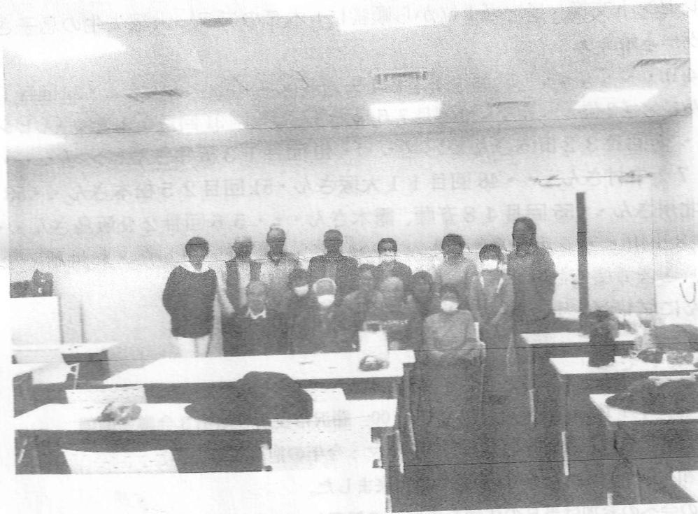
クリスマス会開催記念 2023/12/17