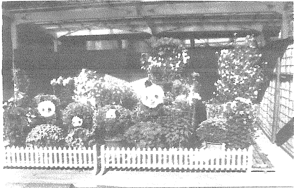
パンダと菊の展示品

ニュー・ヒネマパラダイス、Yesterday、スイングjazzメドレー、最後に日本のふるさとであった。その後、周りにバラ園があり、休憩所において弁当を食べた。その後、小さい桜が咲いており、大変珍しかった。最後に、本部の上にある「東洋ランの女王である」寒蘭の魅力を感じました。これを最後にして、解散しました。大変に良い催しでした。